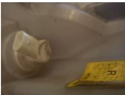
Blinker Birne in der Fassung

Um nun die Scheinwerfereinsätze auszubauen, um sie bspw. zu lackieren, muss die Blinkerbirne samt Sockel herausgenommen werden.