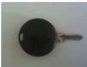
Schlüssel für das Coupé

Bei dieser Modellpflege zum 2nd Generation wurde das Schließkonzept dahingehend geändert, dass die Türen zusammen mit dem Kofferraum entriegelt werden. Dies verringert das Risiko, sich auszusperren.