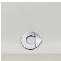
Emblem auf einem Frontpanel

Der Schriftzug und das Designelement tauchen ab jetzt meist getrennt von einander auf, so zierte das Designelement ab jetzt die Front und der Schriftzug das Heck des smart.